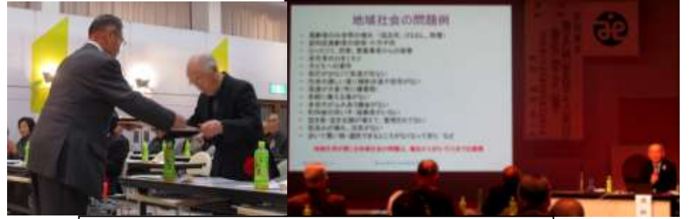
平成29年度社会福祉研究大会の表彰・講演の様子