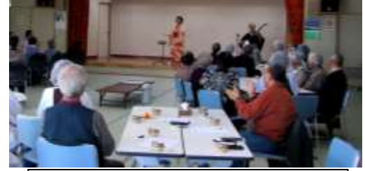
29年度のほ〜っとサロンの様子