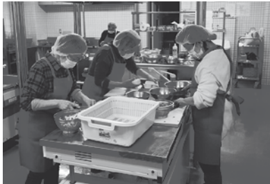
「調理ボランティア」