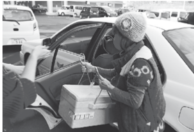
「配送・運転ボランティア」